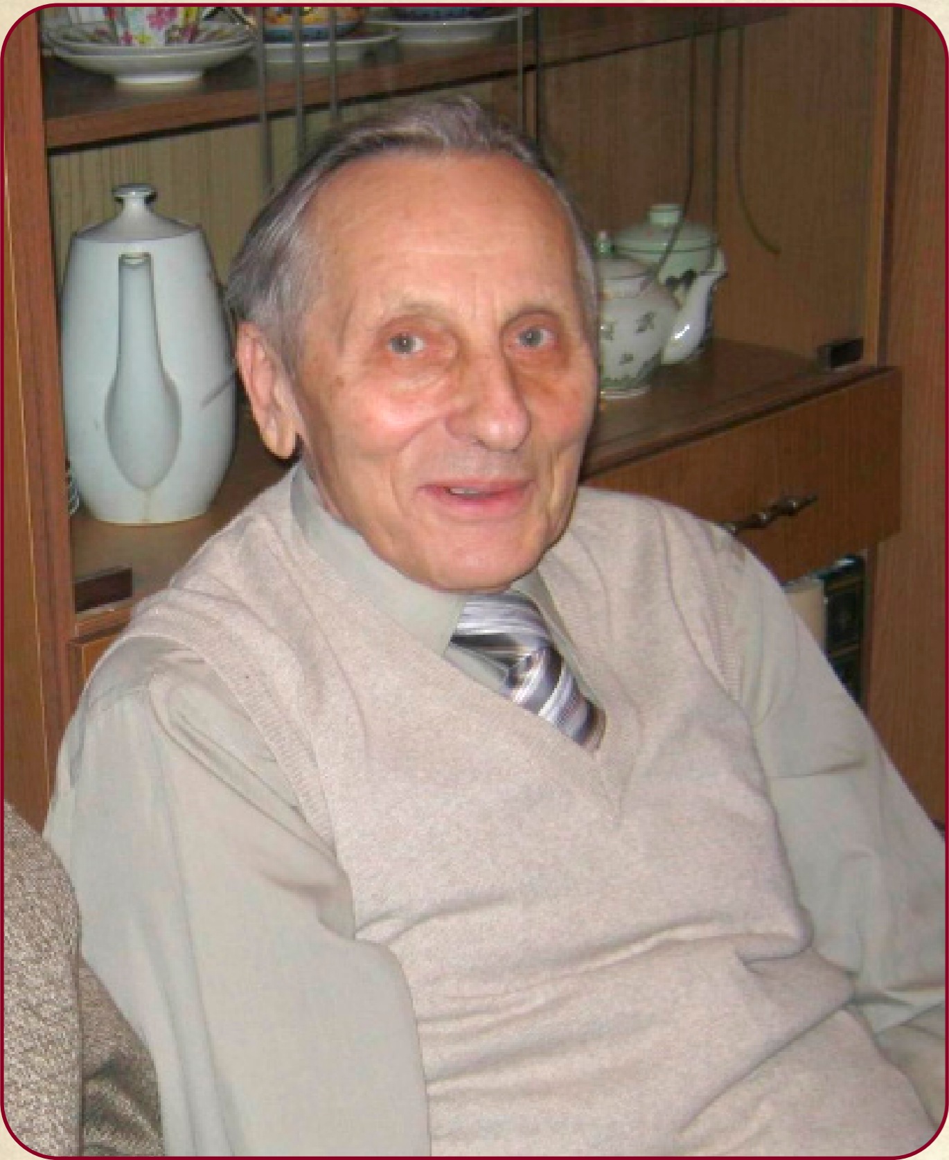
30 декабря 1931 – 18 апреля 2018