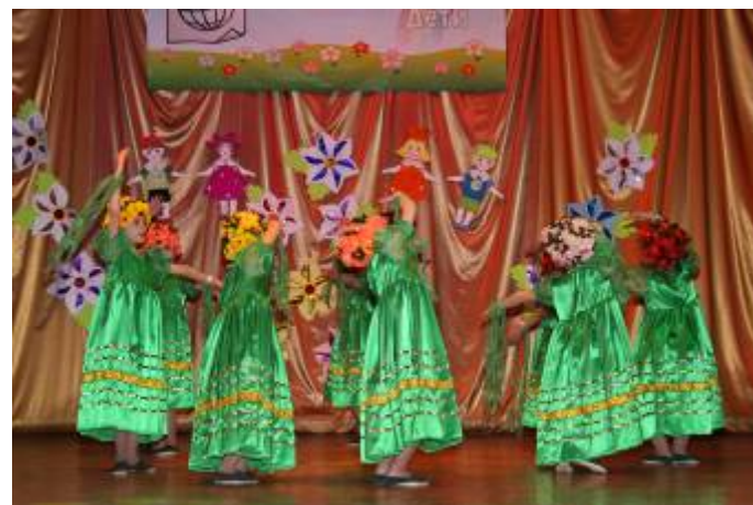
Танец «Цветы в лесу», педагог Ключникова С. К.