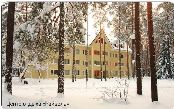
Центр отдыха «Райвола»

27 февраля началась традиционная, LI Зимняя школа ПИАФ НИЦ «Курчатовский институт». Школа включает в себя лекции известных ученых, семинары и выступления по ключевым направлениям: физике атомного ядра и элементарных частиц, физике и технике реакторов, физике и технике ускорителей и теоретической физике. В работе Школы примут участие более 200 представителей не только из университетов Санкт-Петербурга, но и из НИЦ «Курчатовский институт» и входящих в него Института теоретической и экспериментальной физики, Института физики высоких энергий, а также Объединенного института ядерных исследований, МГУ им. М. В. Ломоносова, Национального исследовательского ядерного университета «МИФИ», Московского физико-технического института.