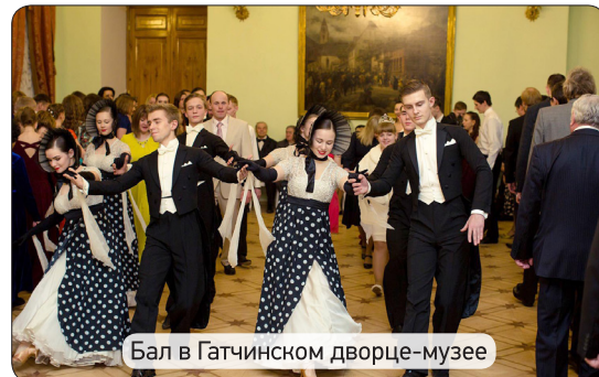
Бал в Гатчинском дворце-музее

За подготовленную программу мероприятий в честь Дня науки стоит выразить благодарность дирекции ПИАФ НИЦ КИ и Совету молодых ученых и специалистов за прекрасно организованный праздник.