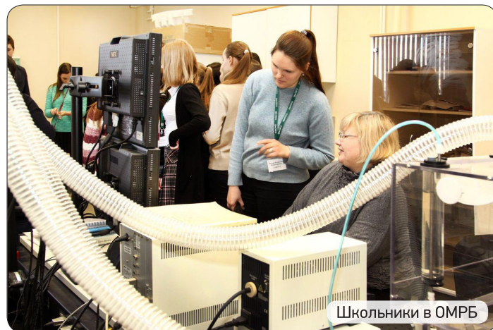
Школьники в ОМРБ

ПИАФ НИЦ КИ надеется на плодотворное сотрудничество с МБУ «Гатчинский дворец молодежи» в подборе лучших выпускников школ Гатчины и Гатчинского района, желающих продолжить обучение в профильных вузах Санкт-Петербурга с последующим трудоустройством в нашем Институте.