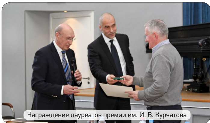
Награждение лауреатов премии им. И. В. Курчатова