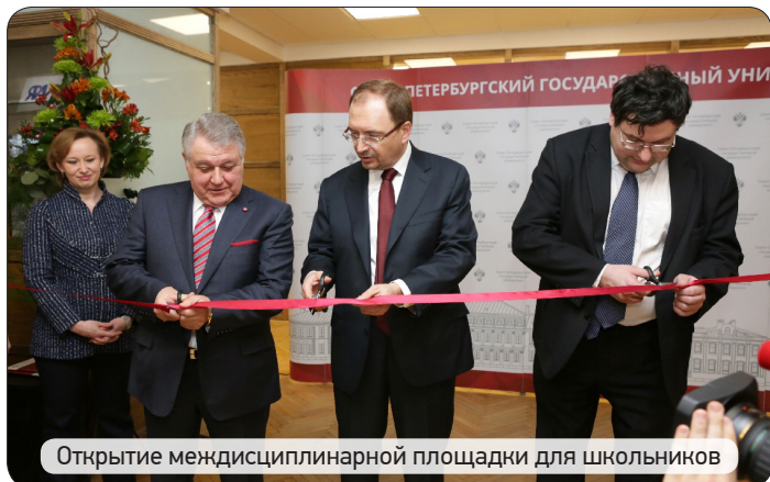
Открытие междисциплинарной площадки для школьников

3 февраля в Санкт-Петербургском государственном университете (СПбГУ) на базе образовательного ресурсного центра по направлению «Физика» Научного парка СПбГУ состоялось открытие междисциплинарной площадки для школьников. В мероприятии приняли участие директория и сотрудники ПИЯФ НИЦ КИ (далее Институт), а также представители Комитета образования, методисты и учителя физики Гатчинского муниципального района.