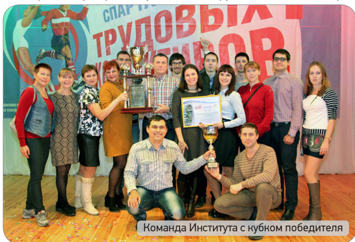
Команда Института с кубком победителя