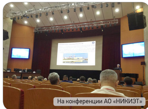
На конференции АО «НИКИЭТ»

Рамки конференции не ограничивались заслушиванием представленных сообщений. Вопросы, поднимаемые в докладах и вызывающие интерес по нормативному обеспечению сооружения, эксплуатации и вывода из эксплуатации атомных реакторов, обсуждались в рамках круглых столов, в которых принимали участие специалисты Института.