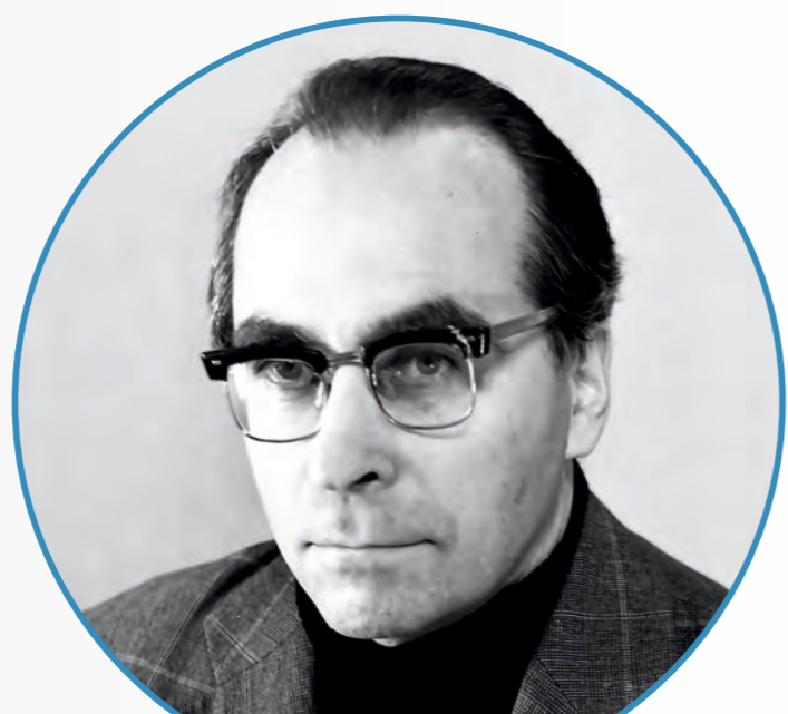
В. М. ЛОБАШЕВ Д. ф.-м. н., член-корреспондент АН СССР